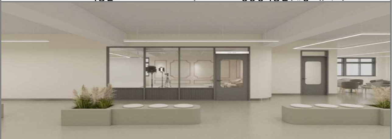
휴 게 공 간