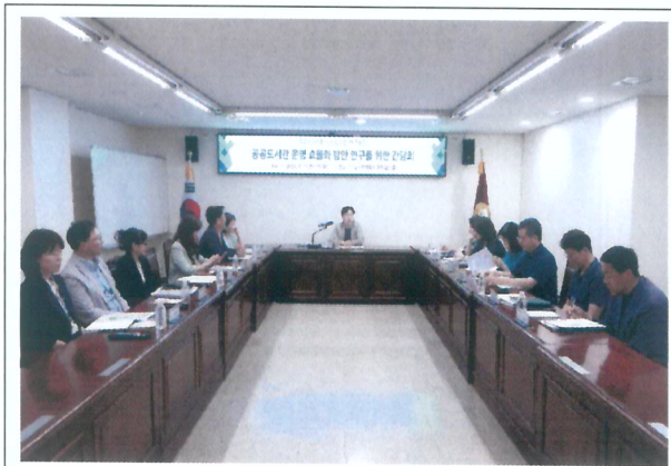
【6개 공공도서관장 간담회】