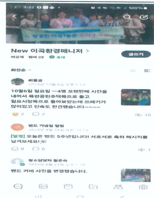
청결지킴이 밴드 운영