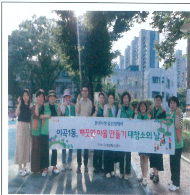
환경사랑 클린업데이 운영